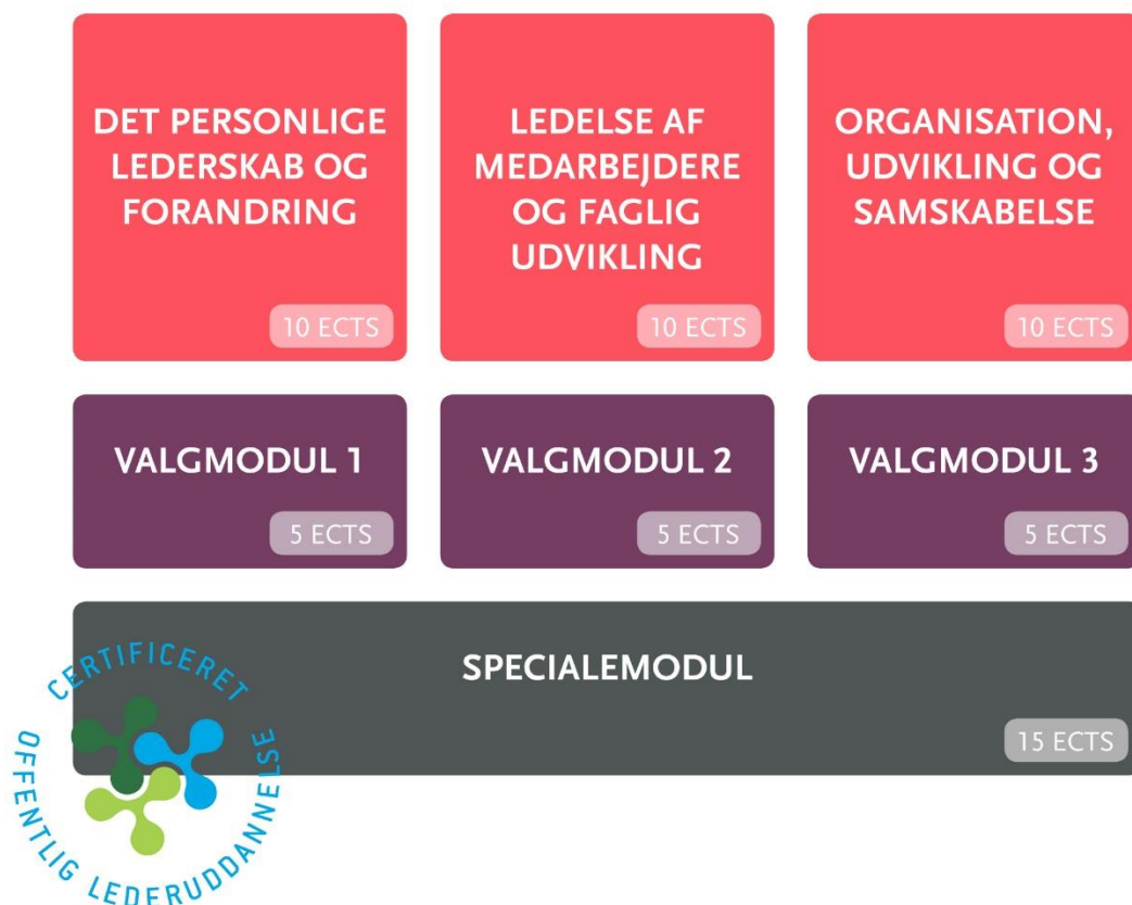
Illustration af de forskellige moduler på Den Offentlige Lederuddannelse:

Alle samlede seks grund- og valgmoduler skal afsluttes før specialemodulet, men kan tages i vilkårlig rækkefølge, så de bedst understøtter den studerendes eller organisationens behov.